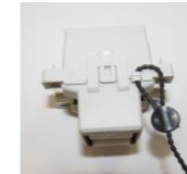
Plombiermöglichkeit bei den Typen