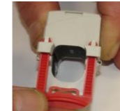
Einsetzen der Fixierspangen